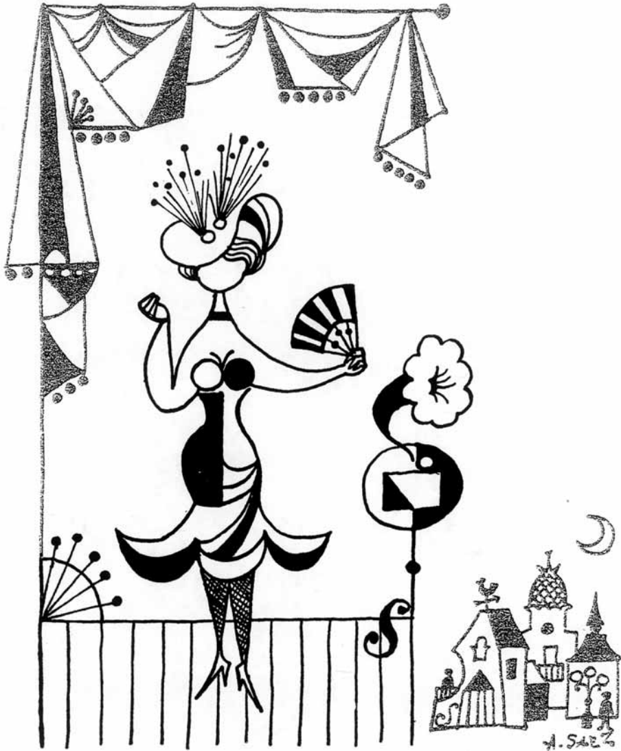
4. La Unión la nuit