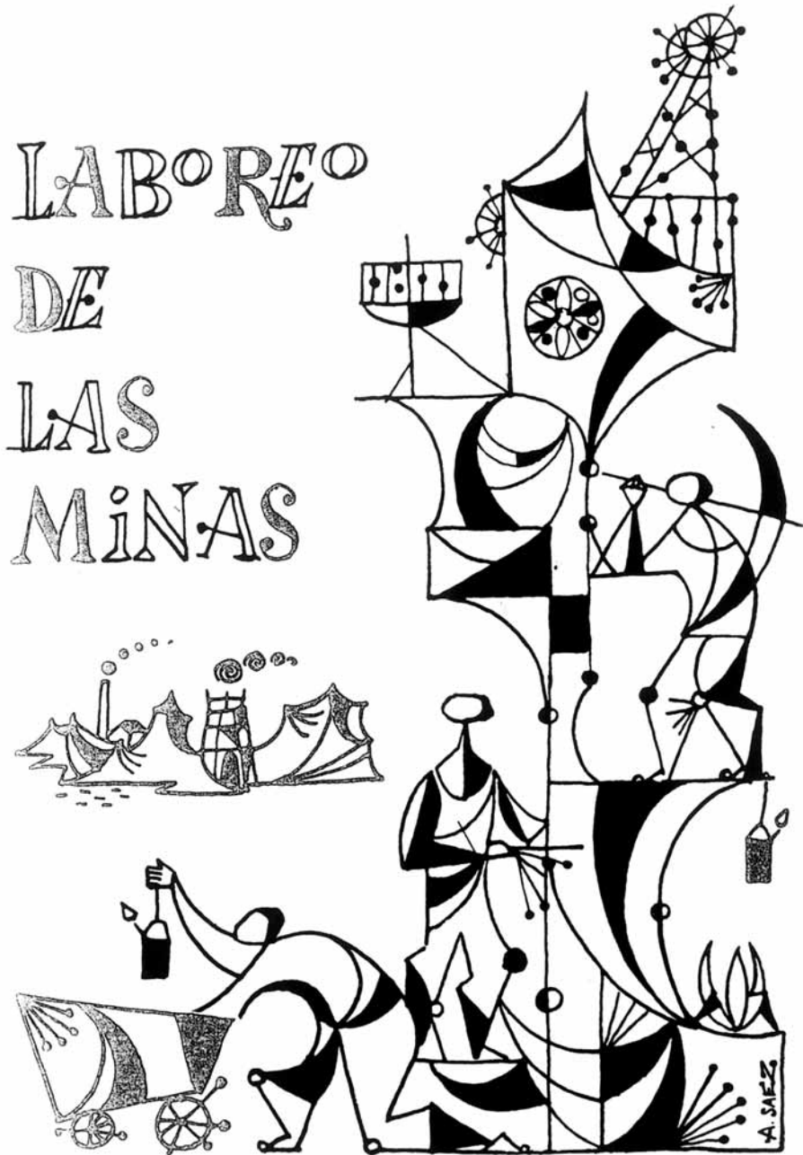
5. La dura vida del minero