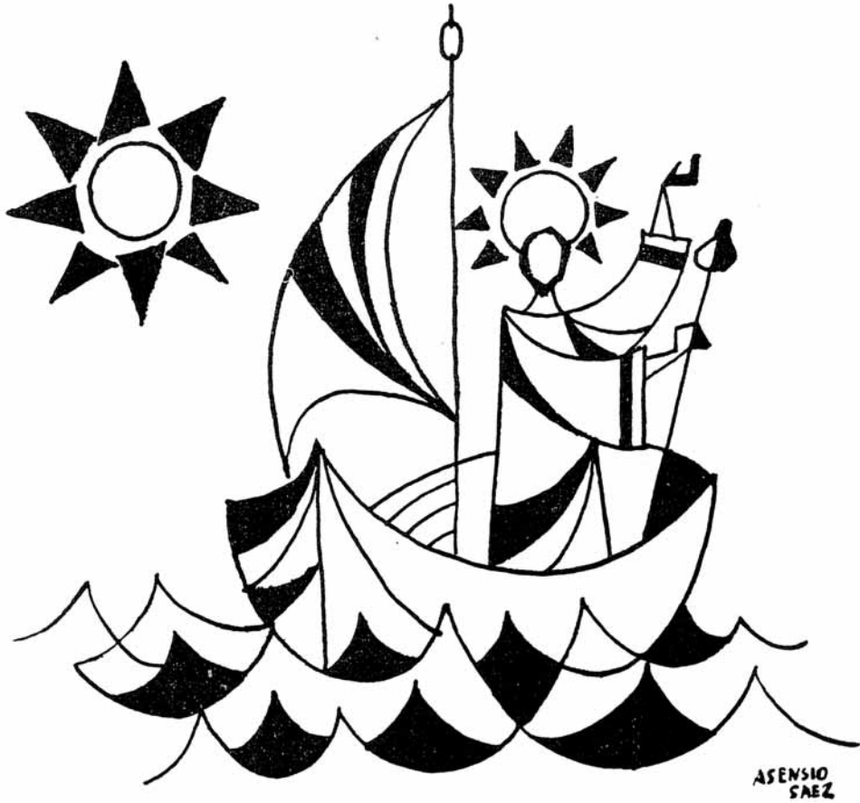
2. Ilustración sobre el supuesto desembarco de Santiago en Cartagena