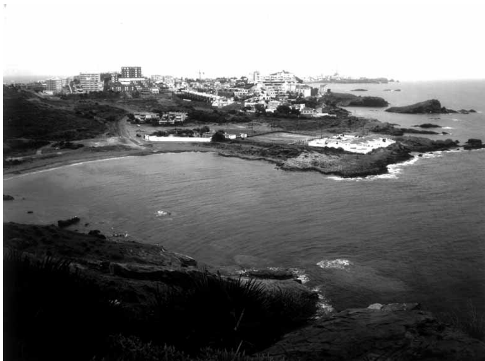
6. A la derecha, el refugio de Asensio Sáez frente al mar en Cala Reona (Cabo de Palos)