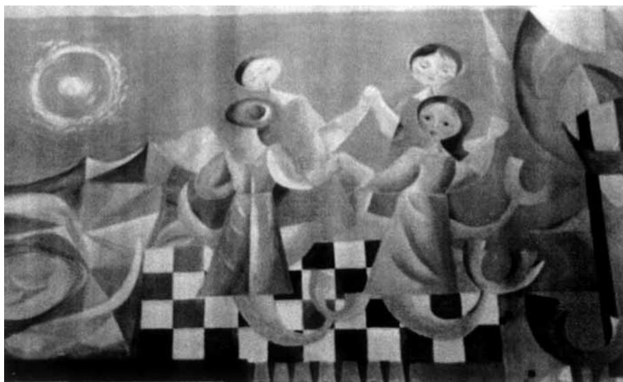
7 y 8. Murales pintados en su residencia de Cabo de Palos