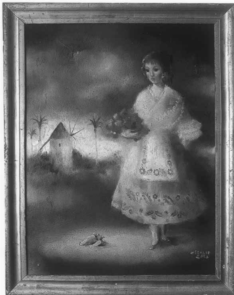
1. Óleo sobre indumentaria del Campo de Cartagena, ilustración para una obra etnográfica de J. Mas

Jorge Aragoneses, M. Pintura decorativa en Murcia, siglos XIX y XX . Murcia, 1964.