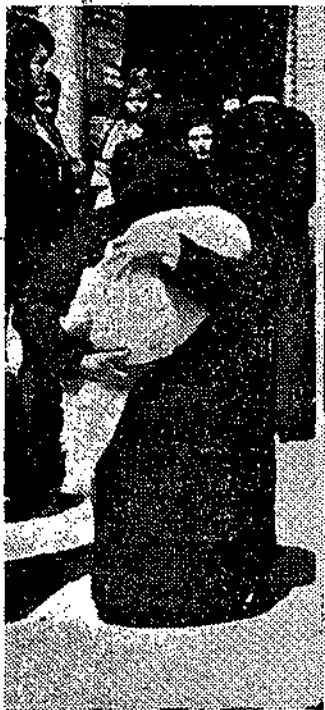
Una mujer. Está de rodillas. Camina de rodillas. Abraza con todas sus fuerzas a su hijo. Ha escondido el rostro. Y yo me pregunto: ¿Le debe ese niño

Aquí está, mi querido amigo, lo que nunca se puede explicar con palabras, lo que no se puede sentir con la sangre, lo que trasciende por encima de todo diálogo. No valen las palabras aquí. Vale el silencio rotundo, la oración sentida, el arrepentimiento sincero.