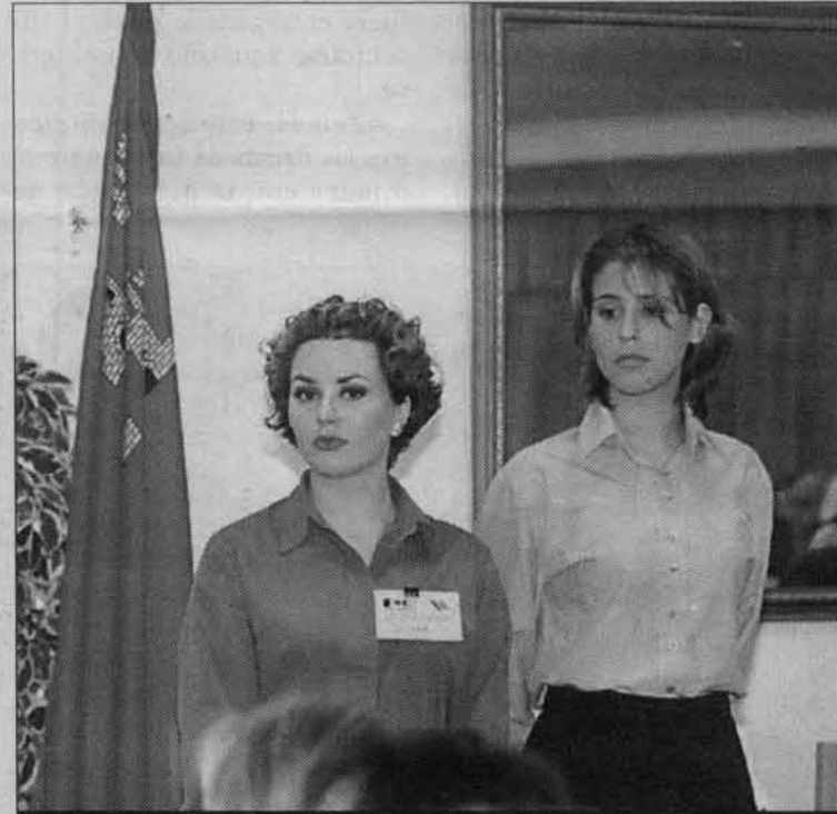
Azafatas del acto celebrado en la Finca Mayor de La Unión