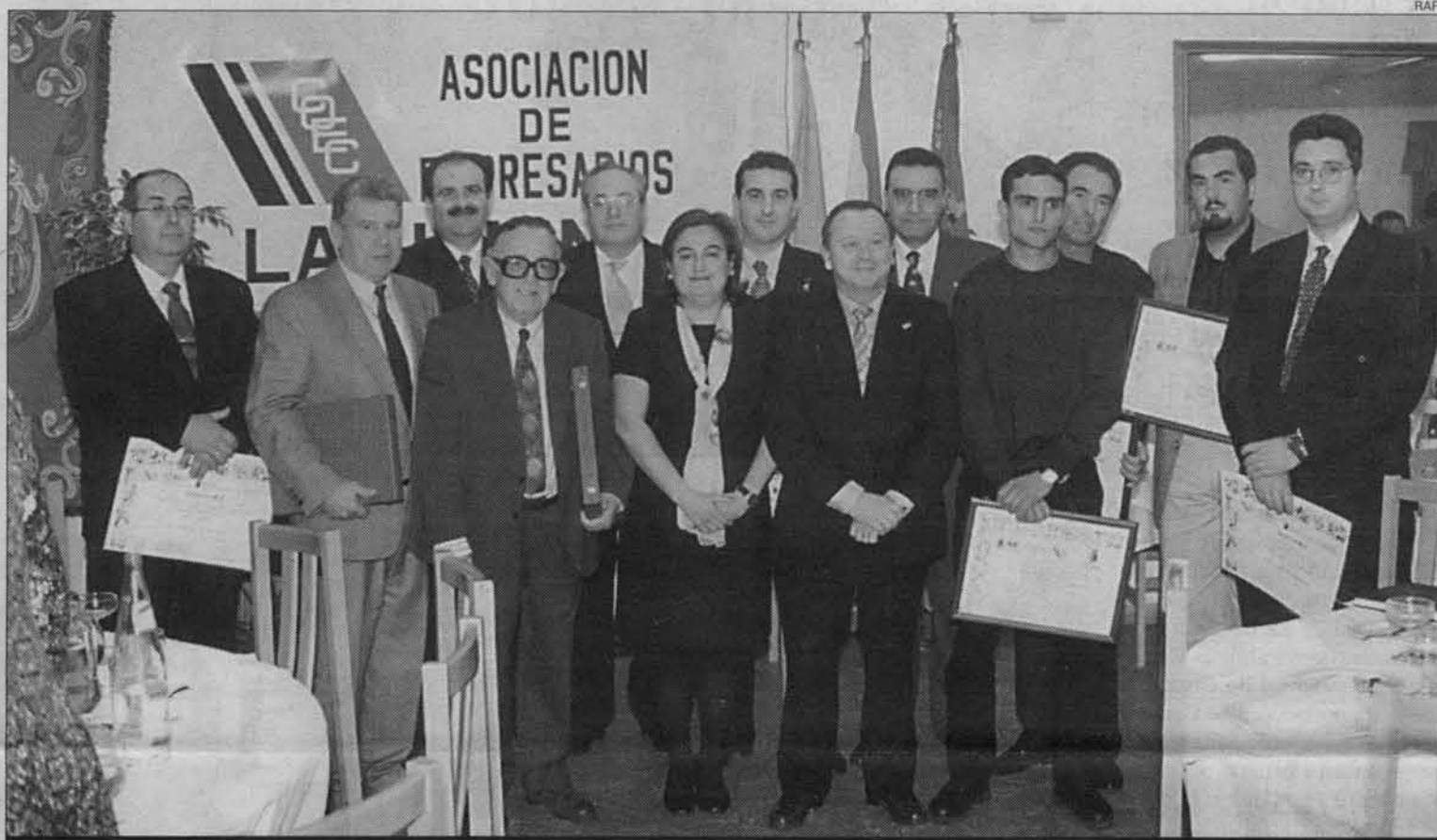
Todos los premiados, en la Finca Mayor de La Unión, donde se celebró el acto de entrega

Casi 200 personas asistieron al acto de entrega de los premios de la Asociación Empresarial de La Unión