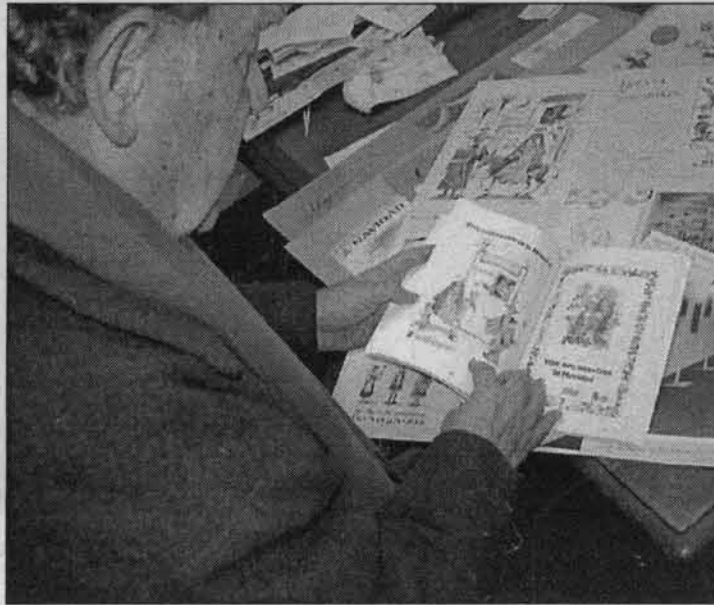
El artista local muestra algunas de sus ilustraciones