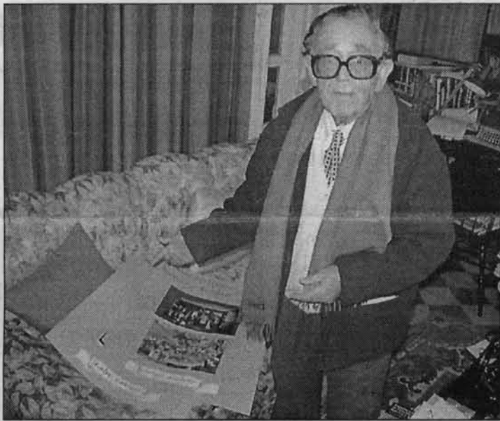
Asensio afirma que lo importante de la Navidad es su humano mensaje