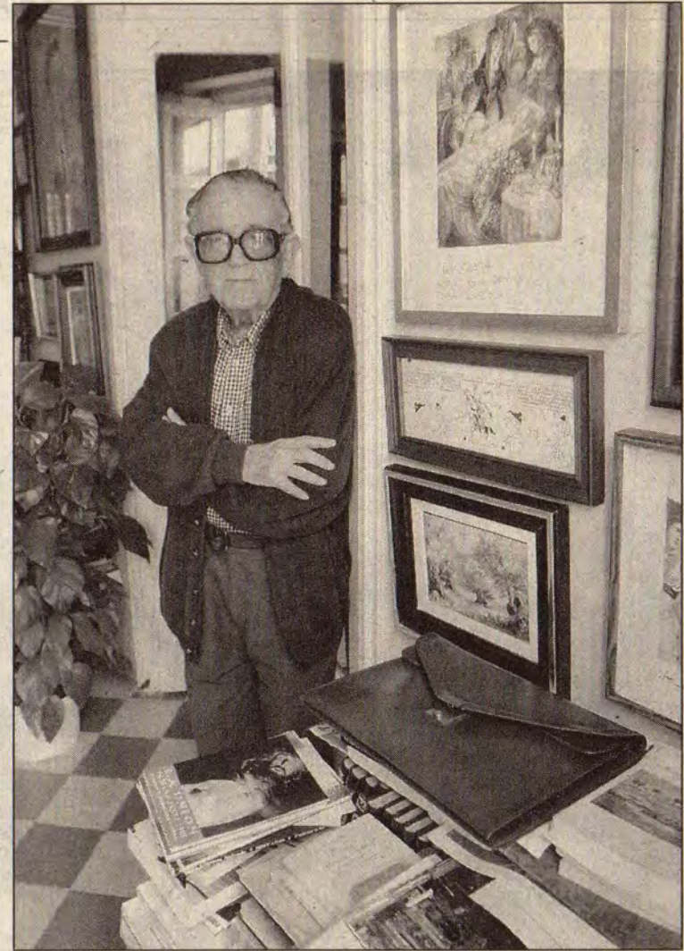
J. M. RODRÍGUEZ / AGM

Un anticipo de lo que Asensio Sáez ha decidido donar se verá en una exposición titulada La Unión retrospectiva , y que se celebrará durante la próxima edición del