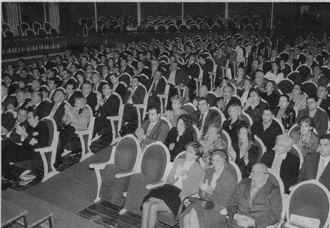
APLAUSOS. Los invitados aplauden durante la ceremonia celebrada en el Romea.

Los galardonados recordaron el papel que ha jugado el texto constitucional en una jornada de abrazos y emociones