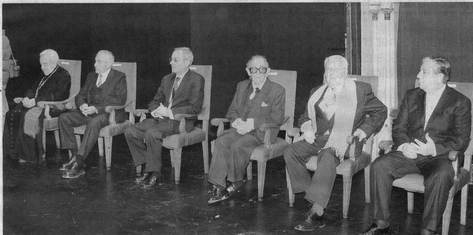
APLAUSOS. Los invitados a la ceremonia conmemorativa del aniversario de la Constitución aplauden durante el acto celebrado en el Romea.