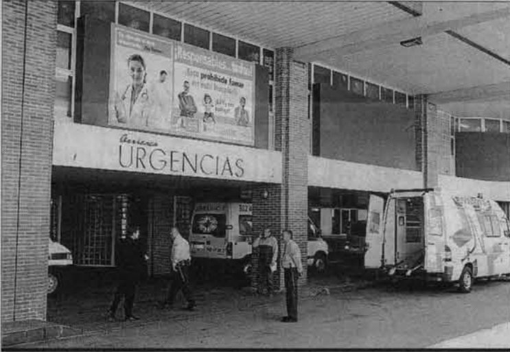
El hospital Virgen de la Arrixaca es líder en investigación biomédica