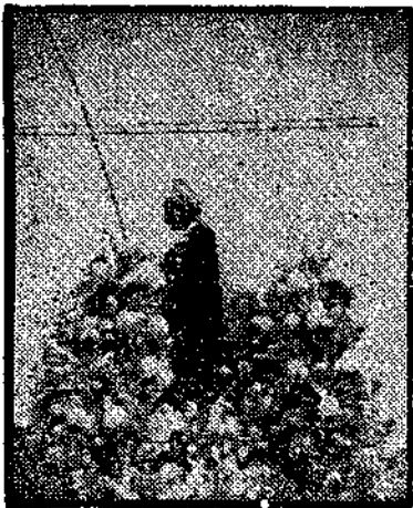
San Juan Evangelista

La estampa vieja va a repetirse una vez más: Bajo el arco de a