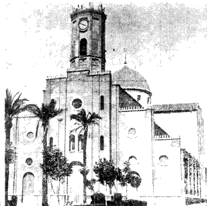
Templo del Rosario.