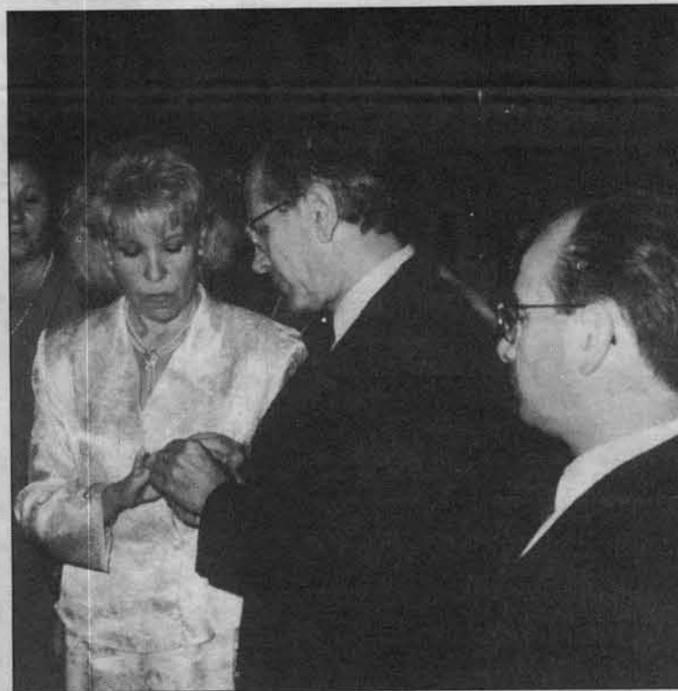
Un matrimonio celebra las bodas de plata el años pasado.

¿No andarán aquí, bajo la piel del verso, muchas de las claves del amor de La Unión a su Patrona, haciendo vigente, todavía y siempre, el gran piropo de su letanía: «Causa de nuestra alegría»?