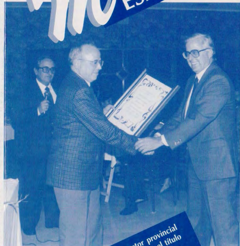
Diseño e Impresión: GRÁFICAS F. GÓMEZ, Avda 13, CARTAGENA