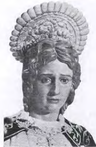
VIERNES SANTO (SANTO ENTIERRO)

De nuevo, San Juan, esta vez en el cortejo del Santo Entierro: “El discípulo es como agua de mar, cuajada en transparencias y reflejos de la divinidad. ¡Qué lejos su barca muerta al sol, crujiendo de sed!”.