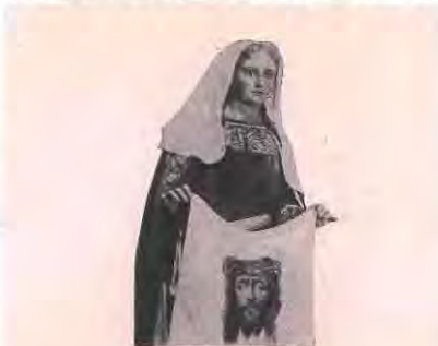
VIERNES SANTO (PROCESIÓN DEL ENCUENTRO) LA VERÓNICA