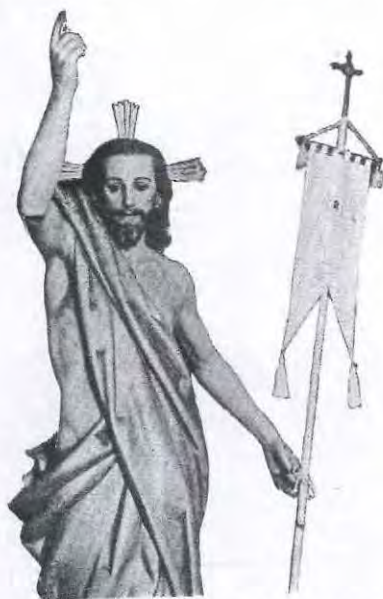
DOMINGO DE RESURRECCIÓN

por Francisco José Ródenas Rozas , Cronista Oficial de La Unión